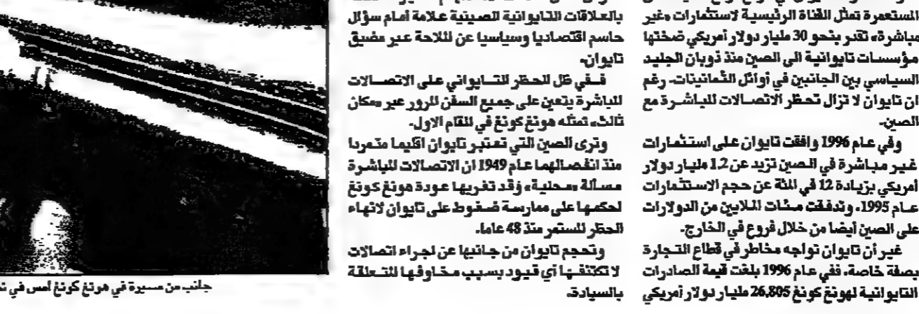
جانب من مسيرة في هونغ كونغ لمن في نطاق بدء الحد التفاضلي لمرورها الى السيادة الصينية بعد 100 يوم